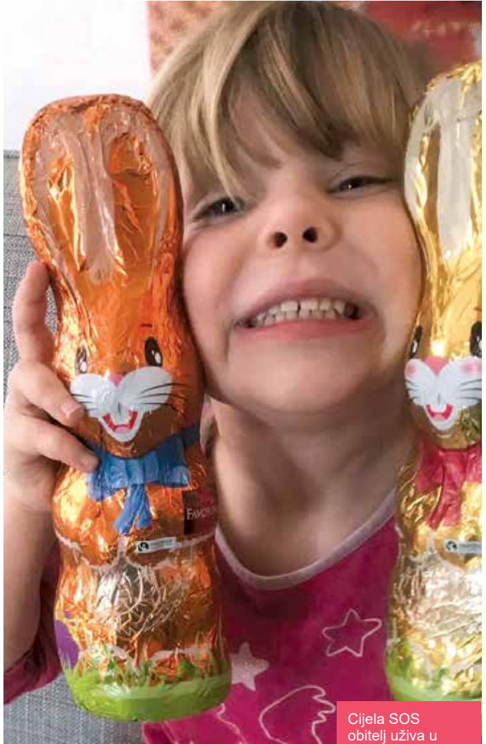
Cijela SOS obitelj uživa u tradicionalnom ukrašavanju jaja koje posebno veseli najmlađe ukućane

Budite i vi zaslužni za osmijehe na njihovim licima! Svojim prilogom putem priložene uplatnice djeci iz SOS dječjih sela učinite ove blagdane još radosnijima.