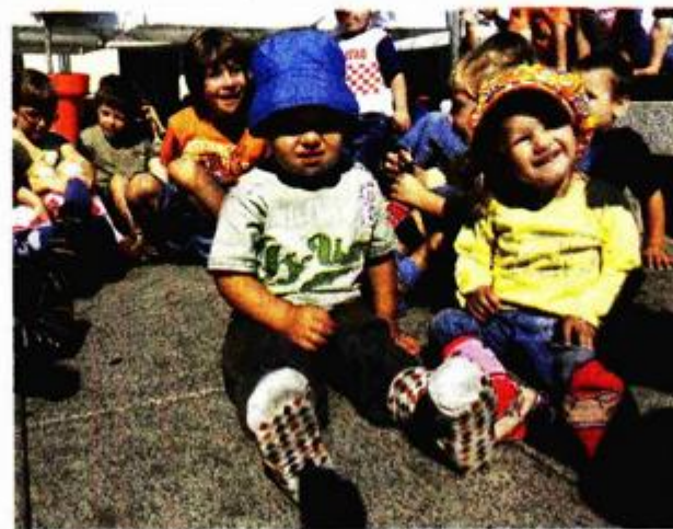
Polaznici vrtića Dugine boje dobili su čarobne čarapice