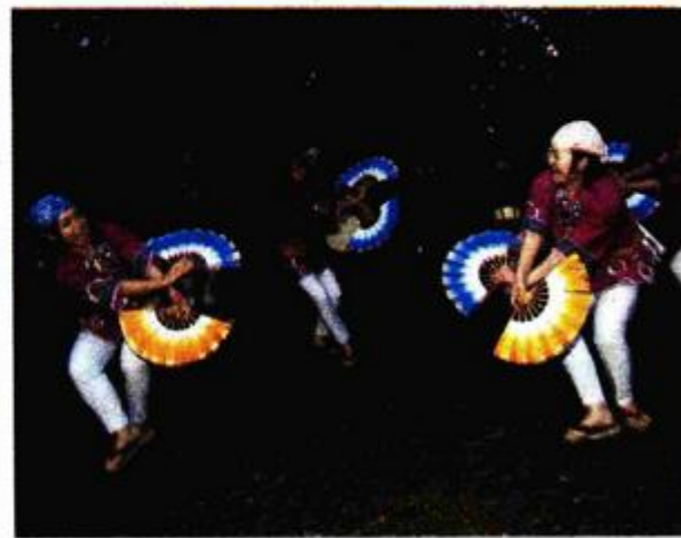
Na otvorenju manifestacije mogao se vidjeti japanski ples