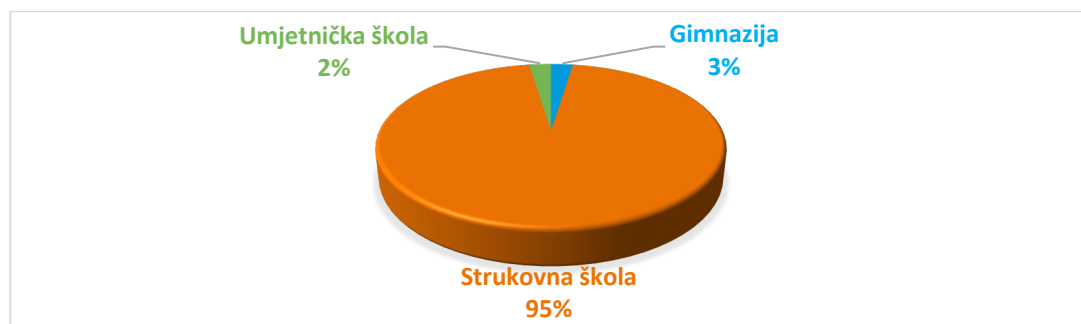
Grafikon 1. Postotak mladih prema vrsti srednje škole koju pohađaju

U sljedeća dva grafikona i tablici 3. slijedi prikaz postotka mladih po vrstama i trajanju škole sukladno klasifikacijama srednjoškolskog obrazovanja Ministarstva znanosti i obrazovanja. Iz podataka je vidljivo da najveći broj mladih iz svih Zajednicam mladih pohađa upravo strukovne škole, od kojih su to u manjem postotku one četverogodišnje, a u značajno većem, trogodišnje škole. U tablici 3. prikazane su sve srednje škole i broj mladih koji ih pohađa.